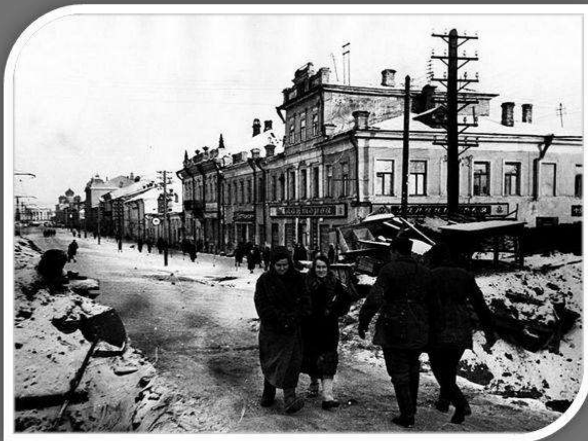
Улица Коммунаров в годы войны

Гитлеровцы бросили на Тулу отборные части: 3-ю, 4-ю, 17-ю танковые, 29-ю моторизованную дивизии и полк "Великая Германия". По существу, это была гитлеровская гвардия. Против них встала рабочая гвардия вместе с зенитчиками и чекистами. Атаки фашистов были ожесточенные.