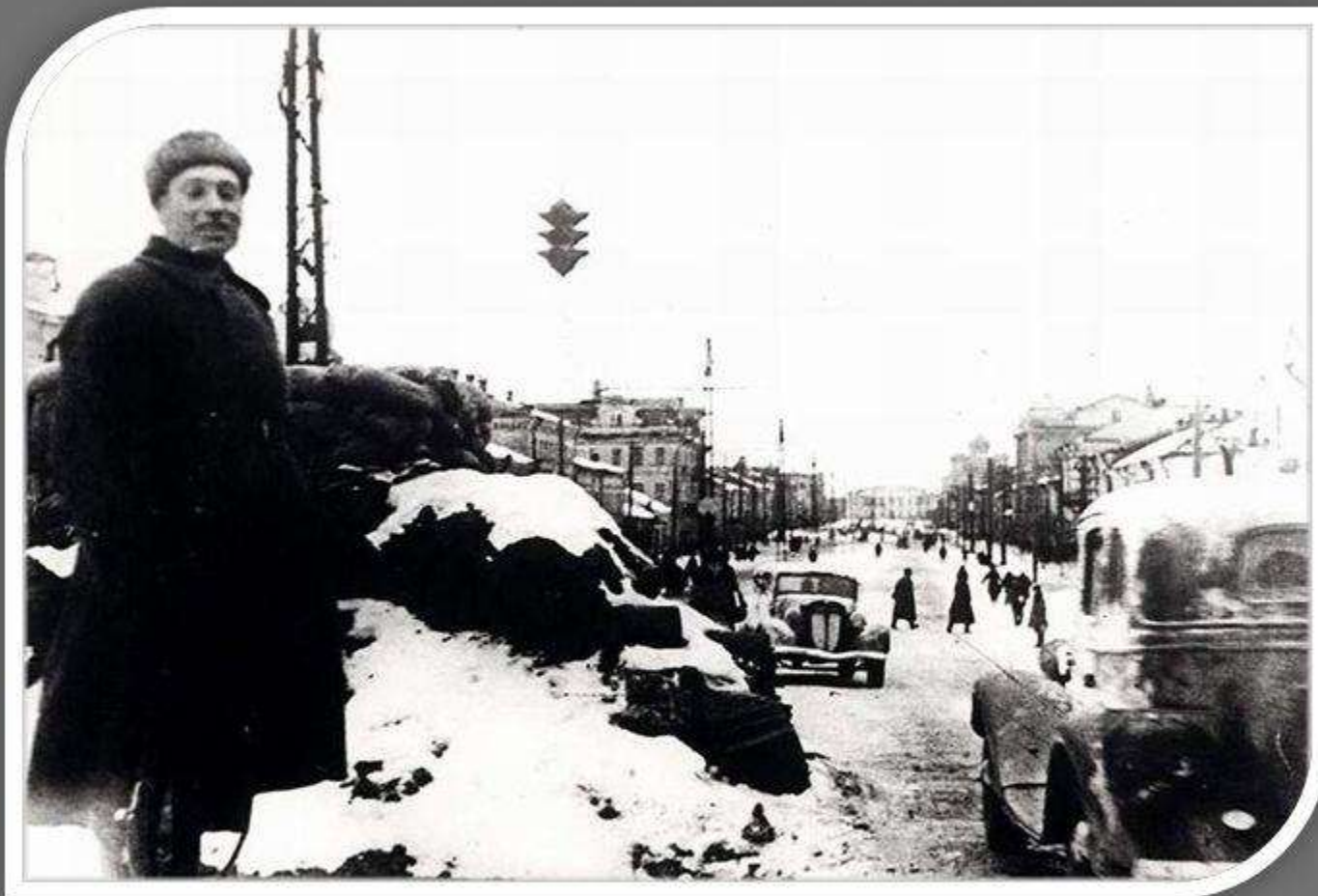
Баррикады на улице Коммунаров

В них участвовало до сотни танков. У нас было много убитых и раненых, но пробиться враг не смог ни на одном участке. И не только не пробился, но и потерял за один день 30 октября 31 танк и много пехоты. Жестокие бои шли и в последующие дни.