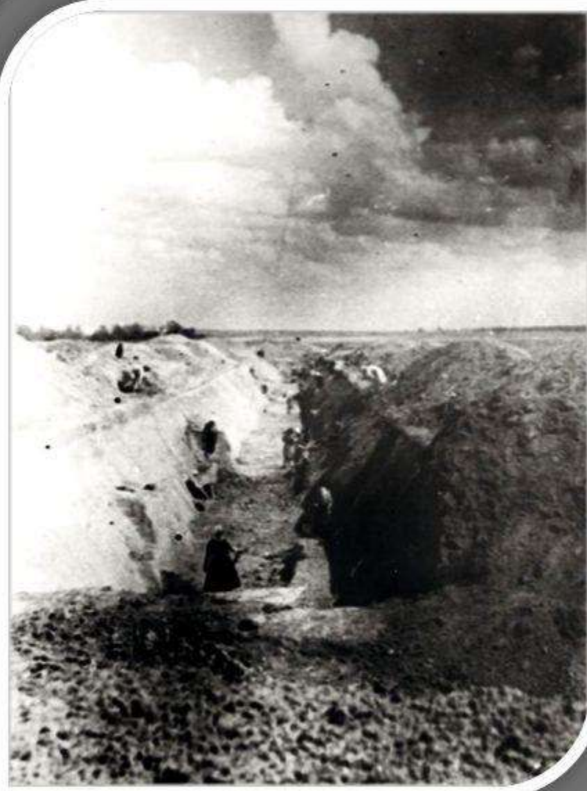
Строительство противотанкового рва.